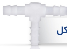
گیره T شکل