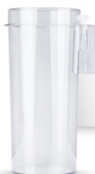
مخزن ۲ لیتری