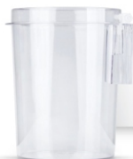
مخزن ۱ لیتری