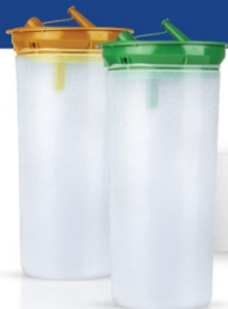
کیسه ۲ لیتری