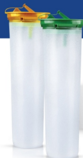
کیسه ۳ لیتری