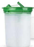
کیسه ۱ لیتری