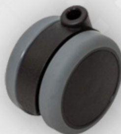
چرخ ساده دارای سایز 75mm با قابلیت تحمل 80kg Caster