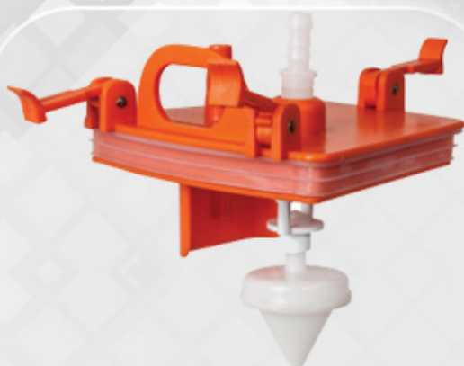
درب جار به همراه شناور 1000cc Jar Cap(Lid)