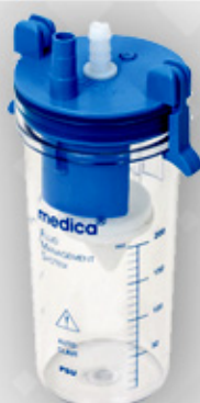
جار محافظ در حالت اضطراری و برای محافظت هرچه بیشتر از دستگاه تعبیه شده است . Safety jar