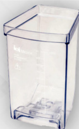
جار 1000cc Jar