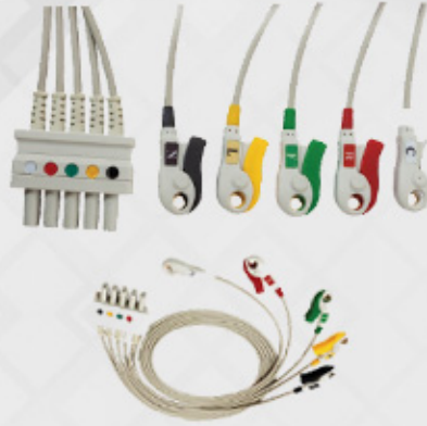
ECG patient cable 5 lead