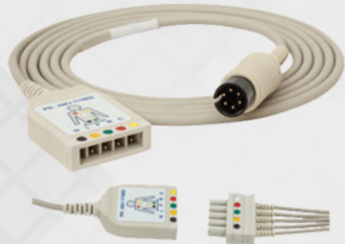
ECG Extension Cable