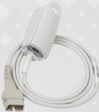
Pulse oximeter Dolphin Oximetry Sensor