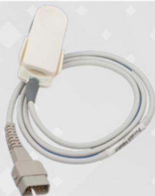
SpO2 Accessories Pulse oximeter Nellcor Oximetry Sensor

انواع کاف فشارسنج برای اندازه گیری فشارخون در سایزهای مختلف برای نوزادان تا بزرگسالان