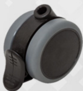
چرخ قفل دار دارای سایز 75mm با قابلیت تحمل 80kg Caster Lock