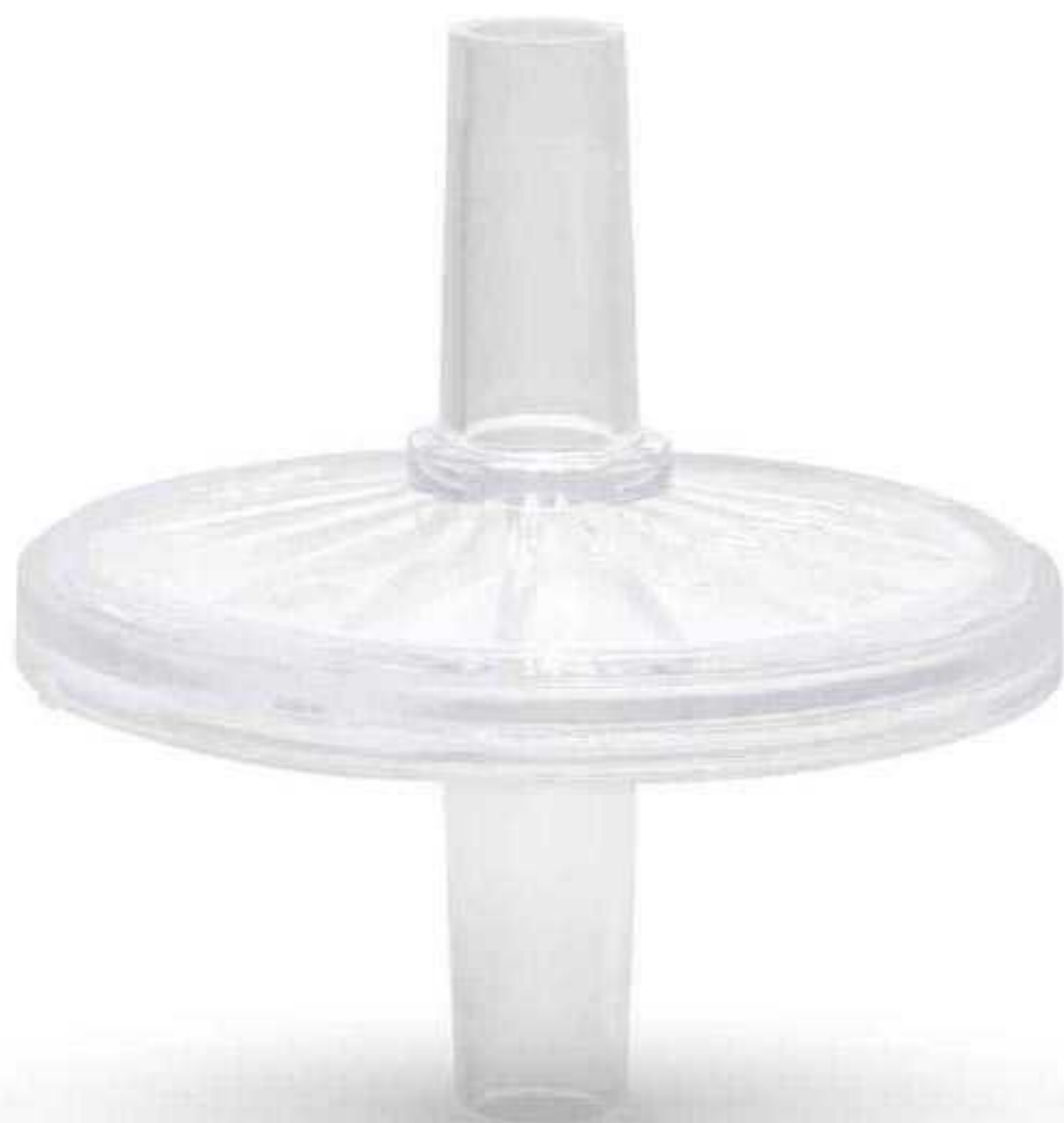
Bacterial Filter فیلتر باکتری