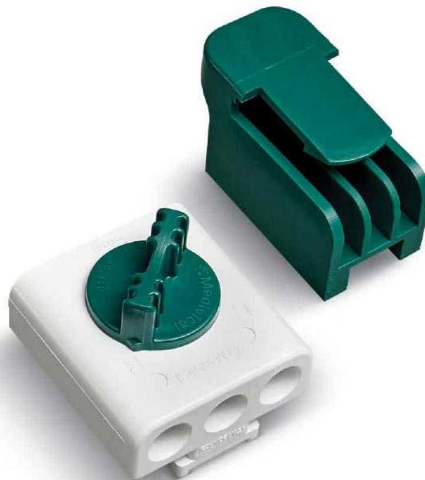
Canister Selection Valve شیر انتخاب محفظه جمع‌آوری