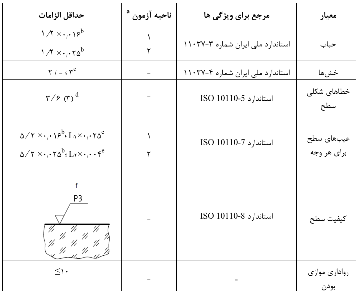
جدول ۲- نقایص مجاز ماده و خرابی‌های عملیاتی

a برای مشاهده تصویری از ناحیه آزمون شکل ۱ را ببینید.